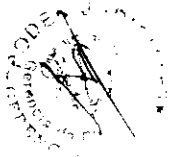
Dr. JAVIER VILLA STEIN Presidente del Poder Judicial